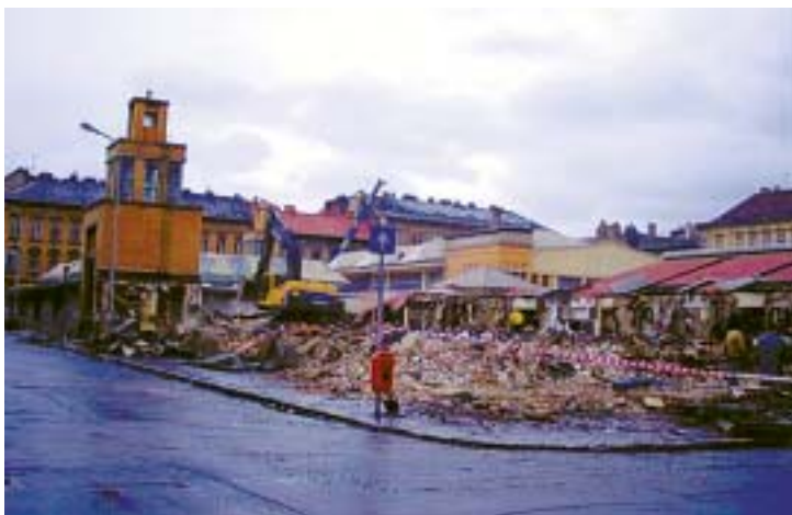
A Garay piac bontása