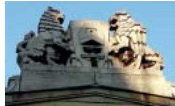
Az „eredeti” Garay piac felett őrködő griff és oroszlán helyet kapott Erzsébetváros címerében is