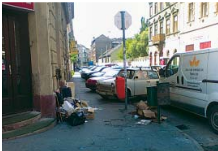
Nem kellett sokáig várnunk egy újabb bejelentésre. Augusztus 25-én a Bethlen-Garay sarkon is szörnyű állapotok uralkodtak...

Ez úton is felhívom a lakók figyelmét arra, hogy Erzsébet-