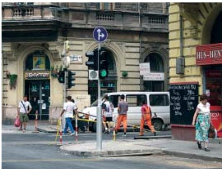
Megoldott „lámpakérdés” a Király-Izabella sarkon

kialakított járdaszigetre. Így megoldódott ez a közlekedési probléma, kérem azonban a lakókat, hogy ha hasonló veszélyhelyzetről értesülnek, hagyjanak számomra üzenetet az ügyfélszolgálaton, vagy telefonon az MSZP frakcióirodán (462-3100).