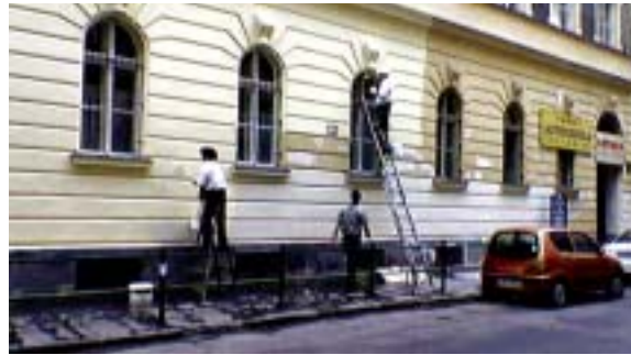
A Dohány utcai iskola fala - elérhető magasságig - tele volt firkálva. Mostanra már végeztek a letakarítással és a homlokzat színének helyreállításával.

mazták az utóbbi hetekben például a Dohány utcai iskolánál és a Wesselenyi utcai közösségi házban, valamint néhány olyan társasházban is, ahol a közelmúltban homlokzat-felújítás volt, - például a Nagydíófa utca 16. számánál.