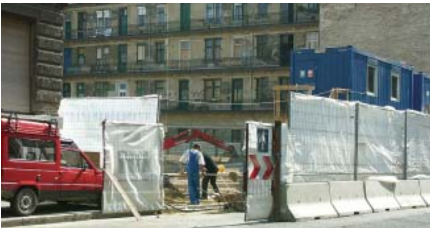
Csak az egyik szomszédos társasház lakói voltak igazán szemfülesek