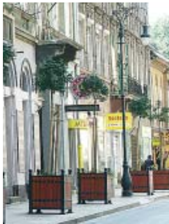
A Király utcai planténerhez hasonlóak kerülhetnek majd kihelyezésre

- A pályázat elnyerése esetén a munkálatokat haladéktalanul elkezdjük önkormányzatunk, azonban a fák kitelepítése után szükség van a lakosság odafigyelésére is, hogy ezek a növények minél tovább díszítsék környezetünket.