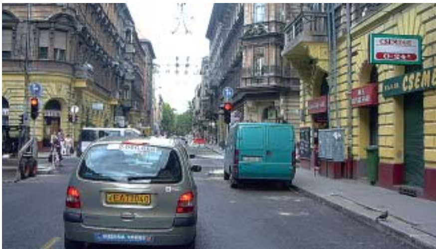
A Bethlen Gábor utcában az átépítés után, akkor is jól látható a jelzőlámpa, ha szabálytalanul teherautó várakozik a sarkon

eleje az Alsóerdősor utcától kétirányú, majd a Rottenbiller utcától egyirányú a csökkenő számolás irányába. A Bethlen Gábor utca és a Nefe-