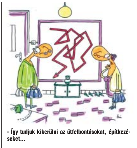
- Így tudjuk kikerülni az útfelbontásokat, építkezéseket...

Más alkalommal az Almássy téren tartott járőrözésük során szirénázó járőrautó érkezett az egyik házhoz, ahol egy betörési kísérlethez hívták ki a rendőrséget. Az egylet munkatársai segítséget nyújtottak a rendőröknek az elkövetők felkutatásában, illetve a helyszín biztosításában.