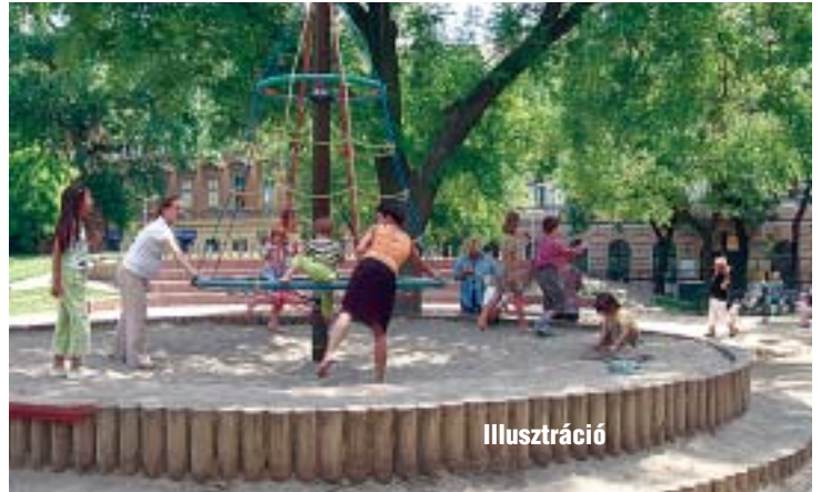
Szerencsések azok a gyerekek, akik szülői felügyelet mellett tölthetik el a nyarat

- A csavargás egyik oka a céltalanság, ami veszéllyel jár. Ennek következménye lehet például a bűncselekményekbe sodródás, amit a munkánk során sajnos sokszor tapasztalunk. Főleg azok a gyerekek veszélyeztetettek, akik nem valami tartalmas elfoglaltsággal, lehetőleg felnőtt felügyelet