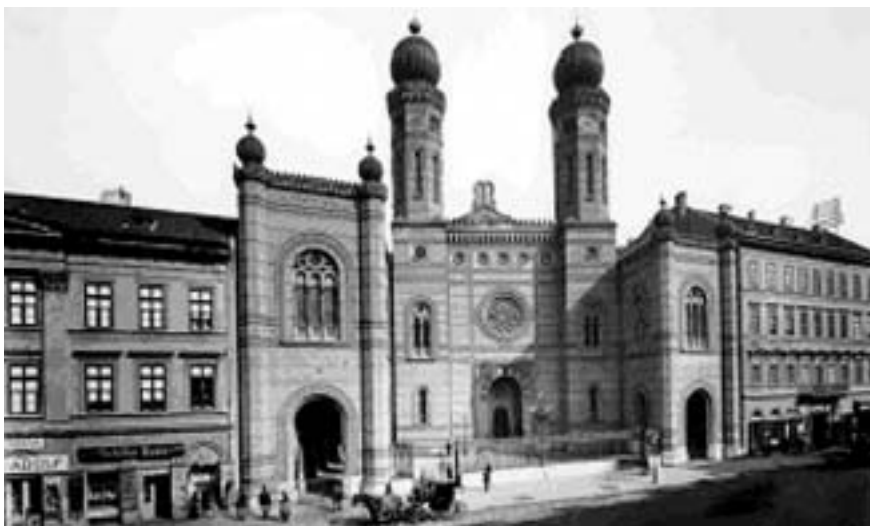
A Dohány utcai zsinagóga. A bal oldalon álló bérházban született Herzl Tivadar

A Dohány utca 2. alatt egykor állt klasszicista házban született Herzl Tivadar (1860-1904), a zsidó állam megálmodója, s az „Ósújországi” című könyv írója. E házat lebontották és helyén 1931-ben készült el a mai épület - Vágó László tervei szerint - amely a zsinagógával való összetartozást tükrözi. Itt helyezték el a Zsidó Múzeumot. Európa egyik leg gazdagabb izraelita kegytárgygyűjteménye található itt. Képet alkotunk a zsidó vallási ünnepekről és az azokon használatos kegytárgyakról és szokásokról. A Múzeum legrégebb emléke egy római kori pannóniai sírkő, szintén látható. Megtudhatjuk azt is, hogy Kossuth nagyra értékelte a zsidóság részvételét és áldozatvállalását az 1848-49-es szabadságharcban, és törvénybe iktatta az egyenjogúsításukat, amit a szabadságharc leverése miatt csak 1868-ban kaptak meg. Különböző termekben helyezték el a zsidóüldözés borzalmait időrendben bemutató dokumentumokat. A Múzeum képzőművészeti kiállításoknak is helyet ad. A Zsidó Múzeum előtti kis teret a közelmúltban Herzl Tivadarról nevezték el.