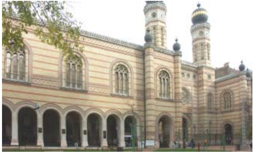
A Dohány utcai zsinagóga

A Kabbalát, amely a zsidó hagyomány szerint Mózesnek a Bibliával együtt adatott a Szináj hegyén, más néven a Tóra mélyének, bensőjének hívják. A Kabbalát a történelem során csak kevesek tanulhatták, mert fennállt a veszélye, hogy valaki elmélyül a misztikában, de megfélemledik a Tórában és a zsidó törvénykönyvekben előírt parancsolatokat teljesíteni. Laikusok számára a Zóhárt és más kabbalisztikus műveket mintha kódnyelven írták volna. A Chábád chaszidizmus e misztikus fogalmakat az egyszerű ember számára is érthetővé teszi. A Kabbala Isten